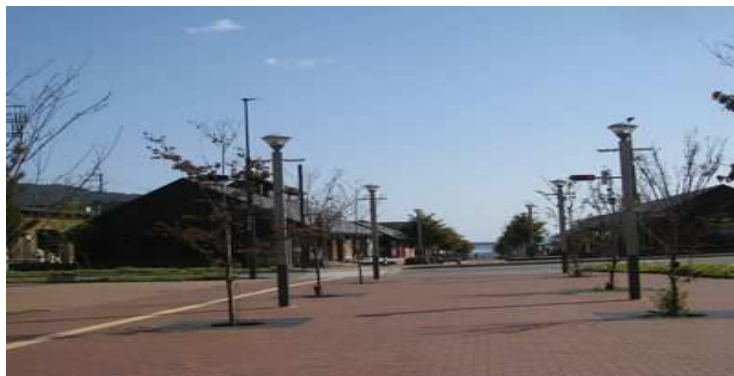
ショッピングモール