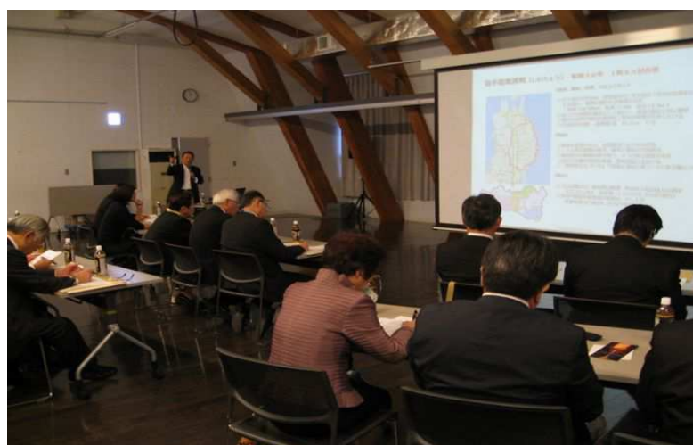
八重嶋取締役から説明を受ける視察者