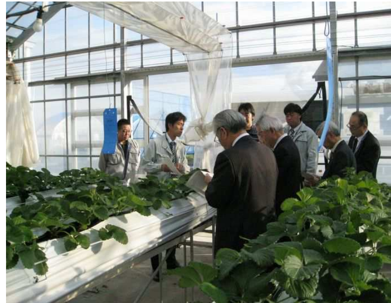
「ハウス内いちご栽培」視察風景