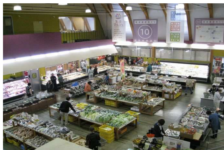
紫波マルシェ（オガールの「道の駅」）