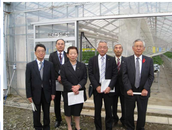
鹿嶋市議会都市経済委員会メンバー