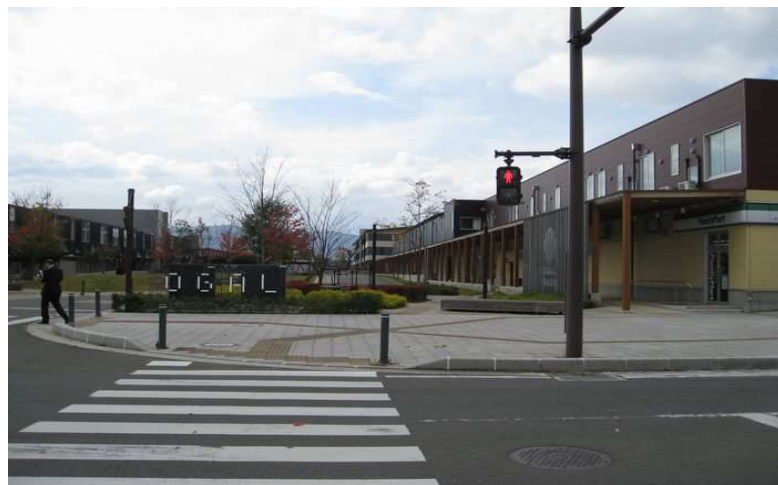
紫波町の駅前風景